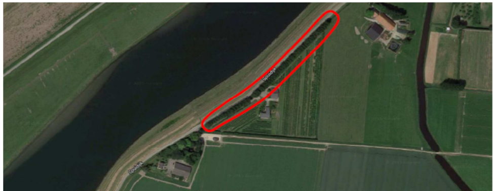
De populierenrij (rood omlijnd) naast de Landelijke Korendijk

Op woensdag 3 februari en donderdag 4 februari kappen wij de populieren ter hoogte van Spuidijk 38A. Wij starten met onze werkzaamheden om 07.00 uur en werken tot circa 16.00 uur. Het kappen van de bomen is nodig om ruimte te creëren voor de dijkversterking. In dit project worden bomen grotendeels gecompenseerd.